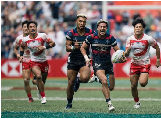
Hong Kong 7s - April