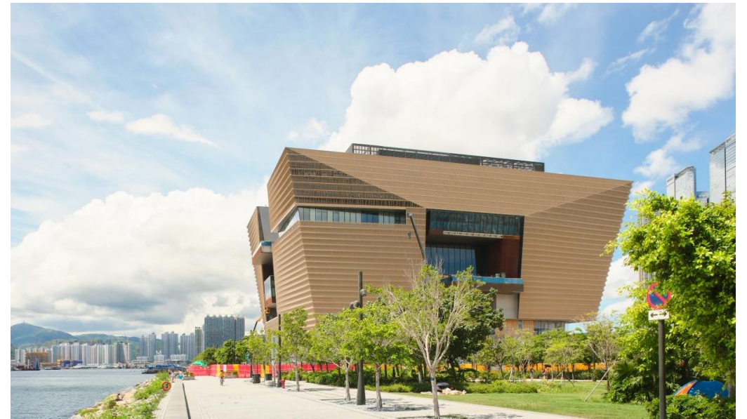
Hong Kong Palace Museum