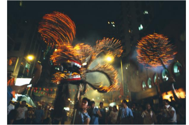
Tai Hang Fire Dragon - September