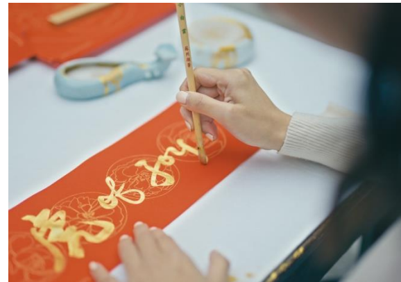
Chinesisches Neujahr- Februar