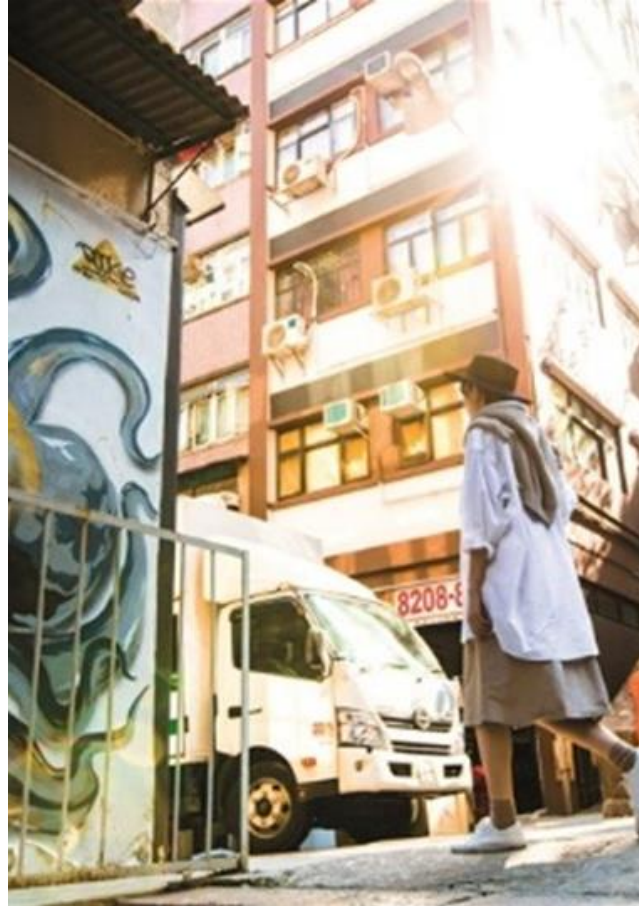
Old Town Central