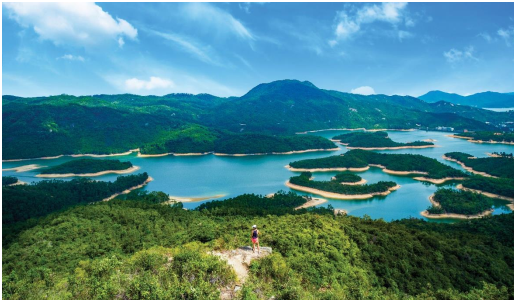
über 260 Inseln