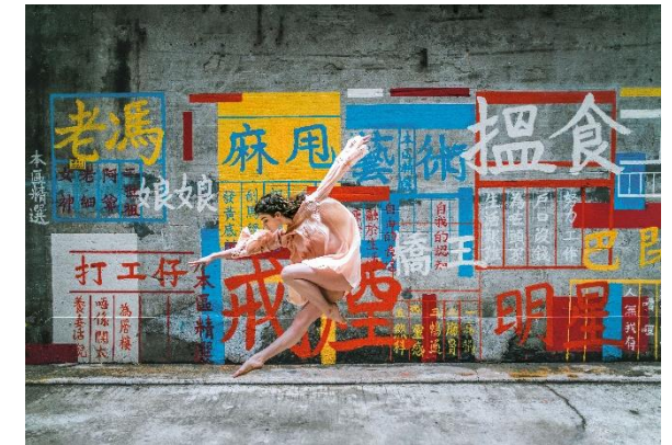
Arts Month - März