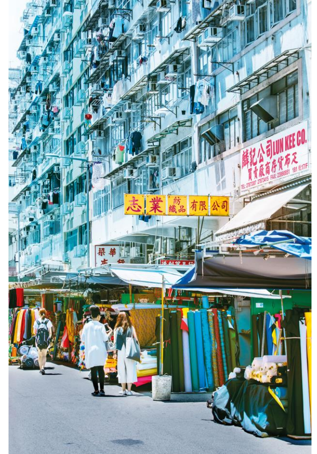
Sham Shui Po