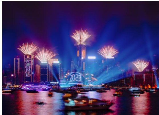
Neujahr - Dezember