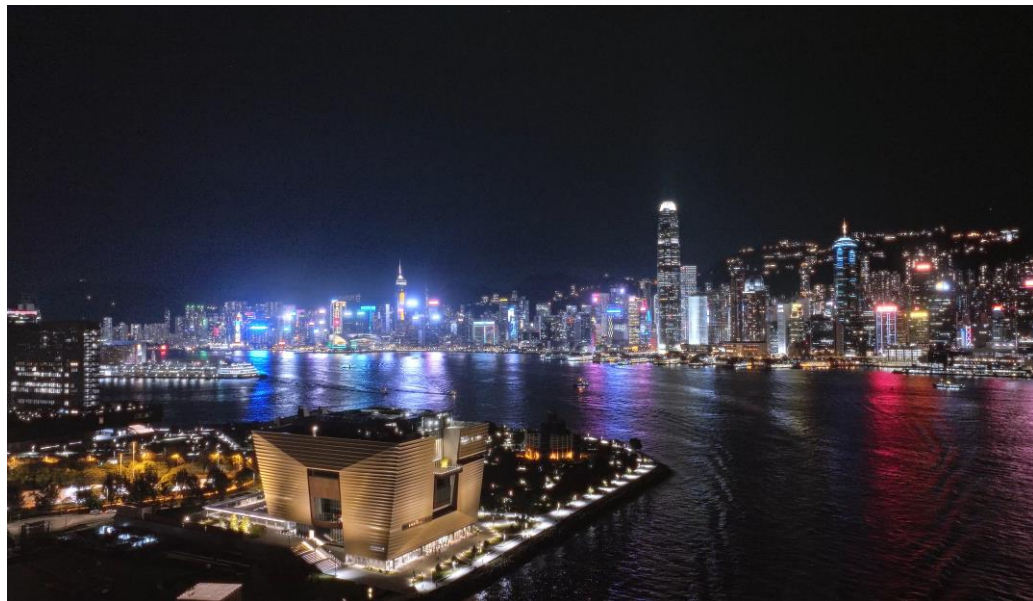
Blick auf Victoria Harbour