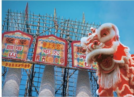
Cheung Chau Bun Festival - Mai