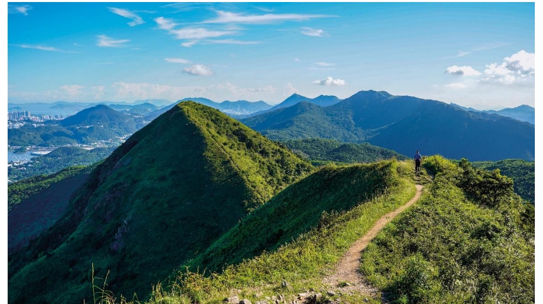
circa 300 Wanderwege