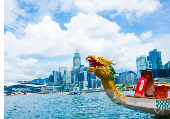
Drachenboot Festival - Juni