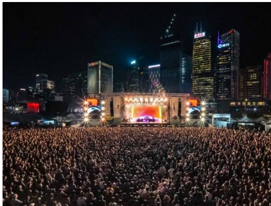
Clockenflap - Dezember